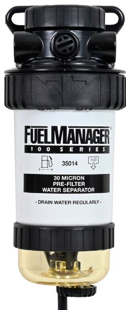
KIT - FUEL MANAGER

Los Sistemas CR modernos están usualmente equipados con filtros de 2 micras en el último del sistema. Las demandas para este último filtro incluyen remover agua, óxido, ácidos, suciedad, piedras, entre otros.