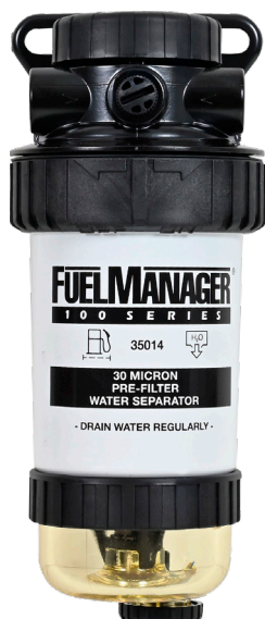
KIT FUEL MANAGER