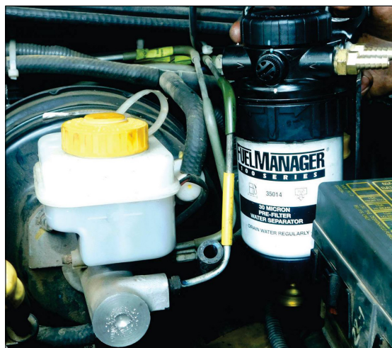
Aplicación KIT Fuel Manager

El Sistema Fuel Manager permite que el grueso de los contaminantes sea removido antes de alcanzar el último filtro. Además, Fuel Manager remueve el 99.9% de toda el agua presente en el combustible, la que queda atrapada en el contenedor transparente.