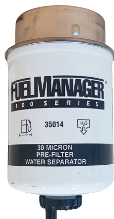
Filtro Trampa Agua